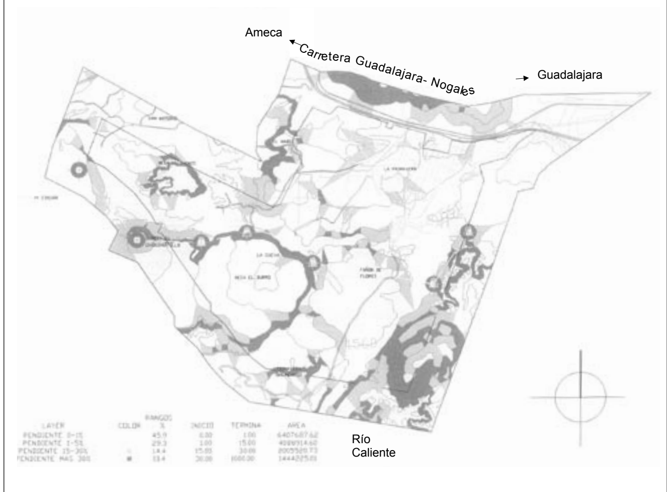
Mapa 1 Proyecto de desarrollo ecoturístico en la serranía de la Primavera Topografía

En estas áreas existen espacios naturales e intervenidos, con sitios de paisajes sobresalientes y recursos que se prestan para actividades recreativas relativamente densas; debido a su topografía, puede desarrollarse el tránsito de vehículos tratando de mantener un ambiente lo más natural posible. Se permiten modificaciones para actividades intensivas como: áreas de día de campo, campamento, caseta de entrada y senderos de acceso, así como áreas de estacionamiento; se acepta la presencia e influencia de concentraciones de visitantes. Se buscará facilitar la educación ambiental y recreación intensiva, de tal manera que armonicen con el ambiente y provoquen el menor impacto posible sobre éste y sobre la belleza escénica.