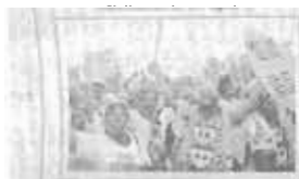
PARTIDARIOS del presidente mexicano Joaquín Salinas recorren las principales calles en busca de más votos. Esta semana habrá comicios y se espera que se haya disturbios.

El pánico de la población migrante en situación ilegal en Estados Unidos aumentaba cada día. El 15 de octubre, Carlos Moreno 1 menciona que, con el fin de reprimir más enérgicamente la inmigración ilegal, la procuradora de justicia estadounidense, Janet Reno, anunciaba nuevas medidas que deberían ser aplicadas en la frontera con México desde Texas hasta California. Estas medidas especificaban que las fiscalías federales de Arizona, Nuevo México y Texas contarían con 50 procuradores adicionales, quienes harían cumplir las leyes de inmigración y reprimirían el contrabando de indocumentados, así como el comercio de documentos falsificados. Además, 15 subfiscales especiales de la división penal del departamento de justicia serían trasladados a los estados fronterizos el 1 de di-