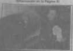
Un sacerdote se niega a ser llevado al norte del país por el gobierno de Salinas. Los sacerdotes en el norte del país se niegan a ser llevados al norte del país por el gobierno de Salinas.