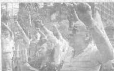
Manifestación del Frente por el Pueblo en apoyo a la propuesta de Enmienda 187 en México.

El presidente de los Estados Unidos, Bill Clinton, pidió a los votantes de California que se abstengan de votar a favor de la iniciativa 187, la cual busca restringir los derechos de los inmigrantes que residen en el estado. Clinton dijo que la propuesta es "contra-productiva" y que no detendrá la inmigración ilegal. Él dijo que la ley podría hacer que los inmigrantes ilegales se escondan en las calles y que podrían ser asesinados. Clinton dijo que la ley también podría hacer que los inmigrantes ilegales se escondan en las calles y que podrían ser asesinados. Clinton dijo que la ley también podría hacer que los inmigrantes ilegales se escondan en las calles y que podrían ser asesinados.