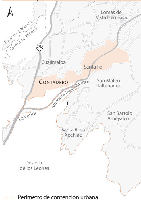
MAPA 1. Polígono de Contadero

lógicas de gestión del territorio a partir de coincidencias y divergencias entre los habitantes. Por ejemplo, en la zona residencial se mantiene una situación de necesidades satisfechas; sus expectativas van encaminadas a buscar determinado nivel de vida, lo que significa no cambiar las condiciones actuales del entorno — que resultan privilegiadas debido a su cercanía con grandes recursos naturales— y con ello el resguardo de su exclusividad habitacional. Por su parte, los pobladores tradicionales y los habitantes de zonas populares buscan mejorar sus condiciones, satisfacer sus necesidades básicas como seguridad y equipamiento público, así como la regularización de su propiedad, entre otros aspectos (Martínez, 2011).